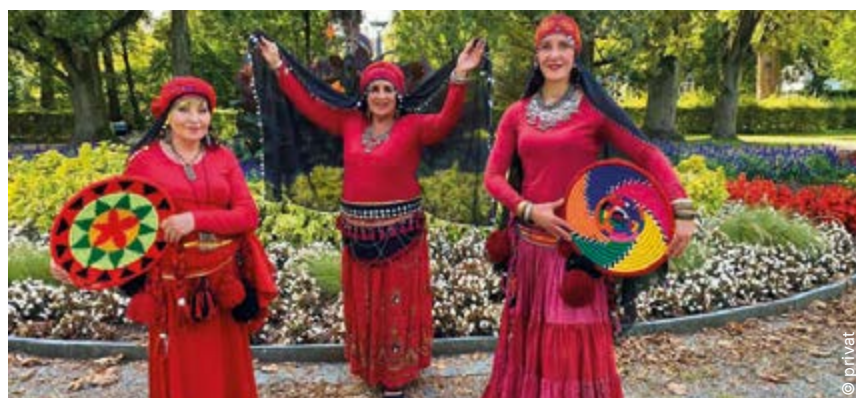
Nach dem Motto „Mittanzen – Informieren – Zuschauen“ kann man sich im Seze mit den traditionellen Klängen und Rhythmen des Orients vertraut machen.

geschulter Klarinetist, der sich auf jiddische und osteuropäische Volksmusik spezialisiert hat.