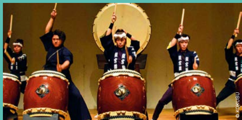
Der März bietet vielfältige Veranstaltungen, wie beispielsweise „Kokubu – The Drums of Japan“ am 09.03.2024 im Bodenseeforum Konstanz.

Eine Auswahl der Veranstaltungen gibt es hier: www.bodenseeforum-konstanz.de/veranstaltungskalender