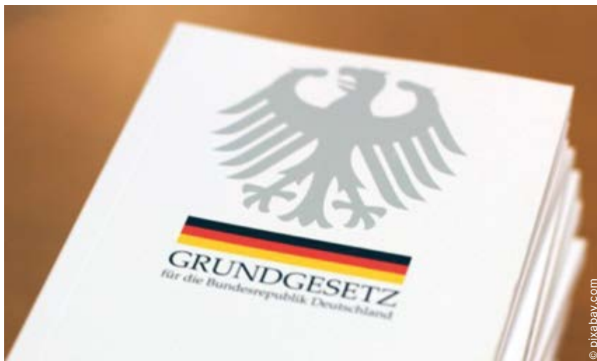
Wahlen sind ein wichtiges Instrument der Demokratie, um aktiv die Politik mitzugestalten.

Wählen dürfen auch Deutsche, die ihren gewöhnlichen Aufenthalt im