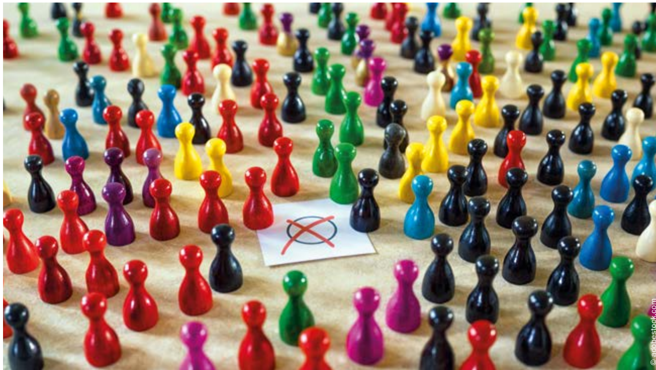
In diesem Jahr werden die Ortschaftsräte, der Gemeinderat und der Kreistag in Konstanz sowie das Europäische Parlament neu gewählt.

Gewählt werden außerdem die Mitglieder der Konstanzer Ortschaftsräte in Litzelstetten und Dingelsdorf (je zehn Mitglieder) und Dettingen-Wallhausen (14 Mitglieder). Wahlberechtigt sind auch hier alle Deutschen und UnionsbürgerInnen ab