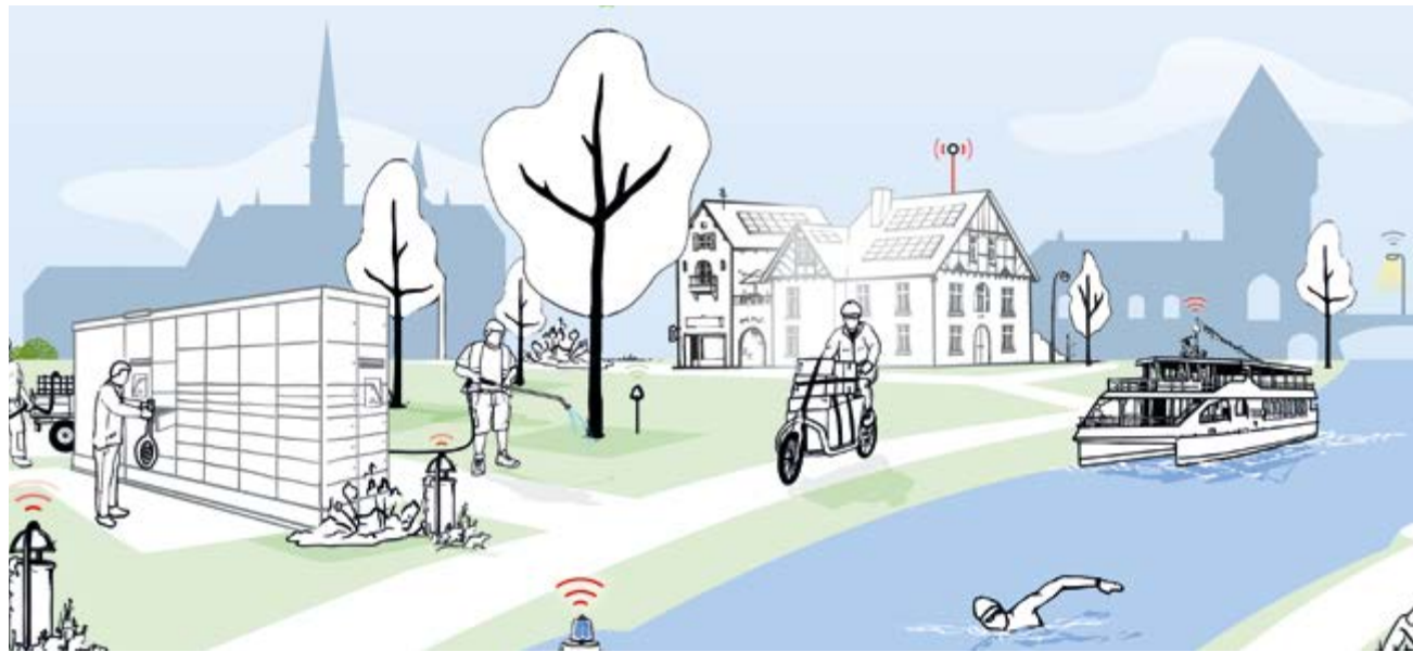
Nachhaltige Stadtlogistik auf der letzten Meile ist eines der Teilprojekte des Förderprogramms Smart Green City.

Es werden zudem zahlreiche Halteflächen für Anlieferungen ausgewiesen, die dann von den Paketdienstleistern digital für bestimmte Zeitfenster reserviert werden können. Davon profitieren dann auch die Handwerks-