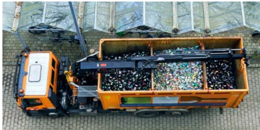
Die Vogelperspektive zeigt: Auch nach der Leerung bleibt das Altglas klar nach Farben getrennt.

Außerdem appellieren die EBK an alle, sich an die angeschriebenen Einwurfzeiten zu halten, also Altglas ausschließlich werktags von 7 bis 13 Uhr und von 15 bis 19 Uhr zu entsorgen. Denn sowohl die Anfahrt mit dem Pkw als auch das Entsorgen der Flaschen in den Containern geht nicht lautlos vonstatten.